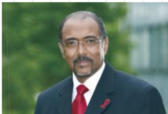
ミシェル・シディベ氏